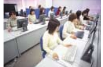
収集・分類センター

それぞれの組織にとっての理想的なアクセスポリシーを、管理者がフィルタリング製品を通じて実現するためには、高品質なURLデータベースが欠かせません。ネットスター社が運営する日本国内最大規模のセンターは、日本のユーザが一番必要とするものをご提供するために、今日も休むことなく収集・分類作業を続けています。